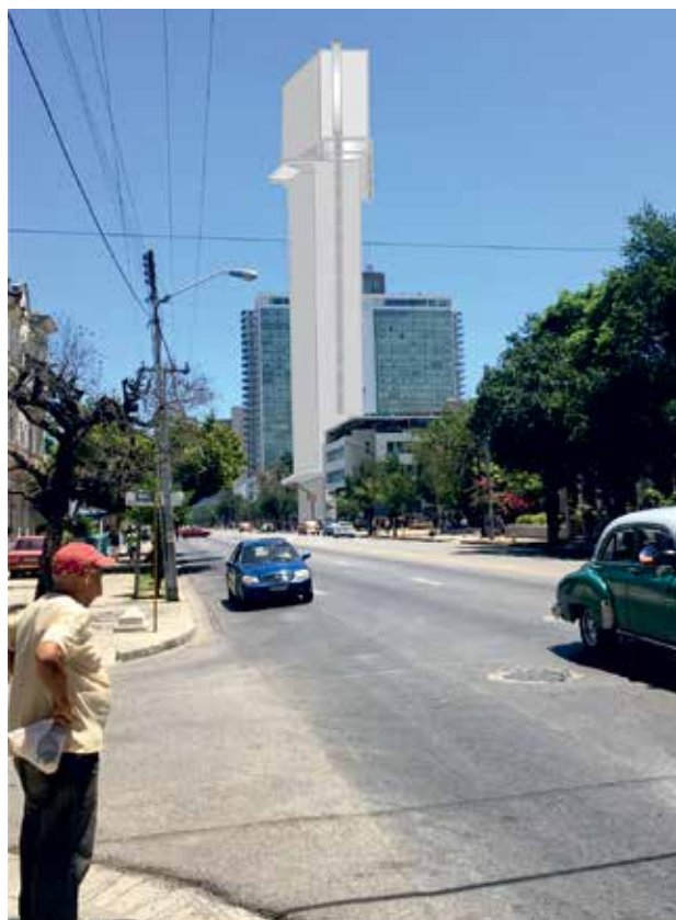
Esta imagen y dos que le siguen intentan representar cómo se vería el hotel de 23 y K una vez construido.